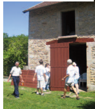
2006 : «couleurs locales» à Drée (21)

château de Châteauneuf (21), abbaye de Reigny (89), basilique Saint-Andoche de Saulieu (21).