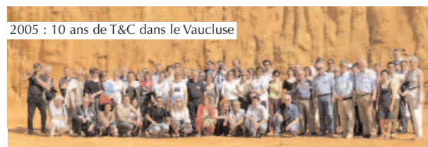
2005 : 10 ans de T&C dans le Vaucluse

Terres et Couleurs organise chaque année des voyages d'étude sur les lieux de production d'ocres et de terres colorantes (Ardennes, Vaucluse, Bourgogne, Italie, Espagne, Hollande, Suède, Chypre, Afrique du Sud, Brésil...). Au total 17 voyages ont été organisés (plus de 900 participants).